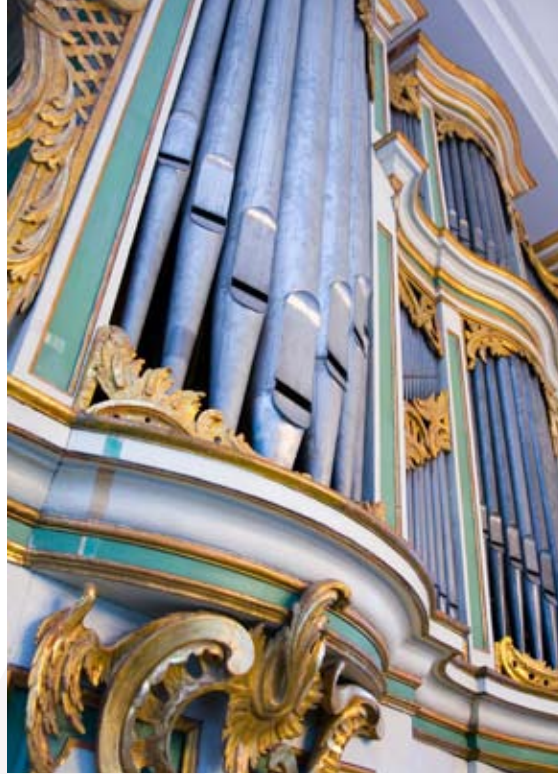
Die Amalien-Orgel ist die älteste erhaltene Orgel Berlins