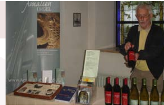
Unser Verkaufsstand mit Postkarten, CD´s und Amalien Wein