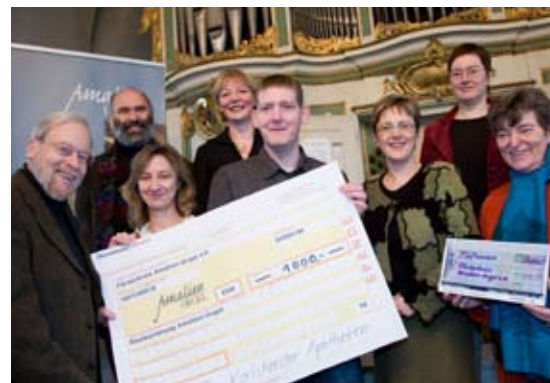
Karlshorster Apotheken und HOWOGE spenden für die Restaurierung der Amalien-Orgel

Sie sind herzlich eingeladen, sich uns anzuschließen. Unser 2003 gegründeter Verein ist in das Vereinsregister des Amtsgerichts Charlottenburg eingetragen. Er ist als gemeinnützig anerkannt. Er hat gegenwärtig (2009) 23 Mitglieder. Wir freuen uns auf neue Mitglieder, die konkret mitarbeiten möchten, heißen aber auch Menschen willkommen, die unserer Stimme durch ihre Mitgliedschaft Gewicht verleihen und die unsere Arbeit durch ihre Mitgliedsbeiträge oder Spenden unterstützen.